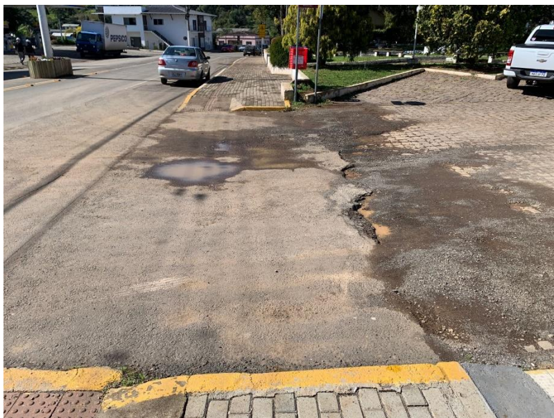
Situação atual dos acessos.

Os acessos existentes se encontram danificadas, onde é necessária sua revitalização com dimensões de acordo com o especificado em projeto. Será usado concreto betuminoso usinado a quente na sua confecção, com uma espessura de 4cm, onde será aplicado sobre o pavimento de paralelepípedo existente. Para sua execução, deveser regularizado a emenda com um corte em linha reta, proporcionando qualidade e estética ao remendo.