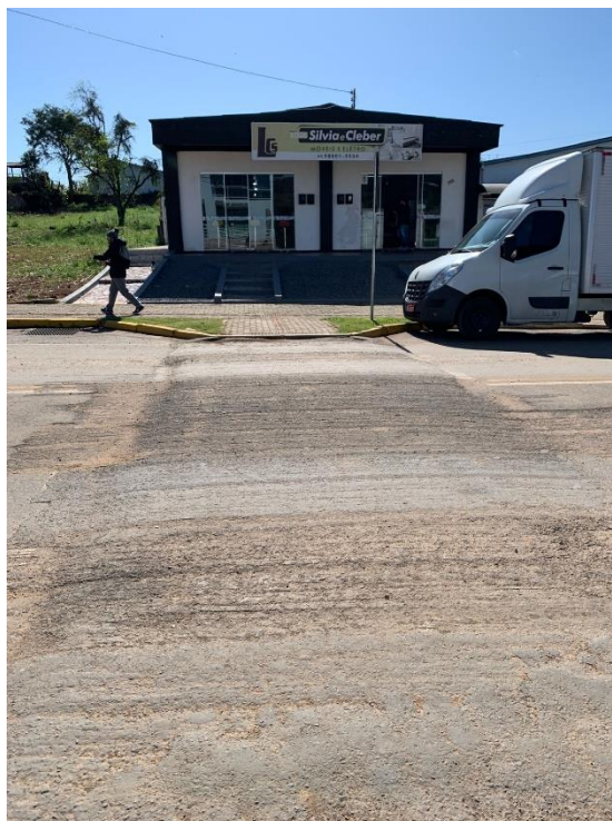
Situação atual das travessias elevadas

As travessias elevadas existentes se encontram danificadas, onde é necessária sua revitalização com dimensões de acordo com o especificado em projeto, sua largura atual é de 8,2m onde será passado para 9,00m havendo necessidade de remoção de parte do canteiro da travessia, que deverá ser removido e reaproveitado os materiais. Será usado concreto betuminoso usinado a quente na sua execução.