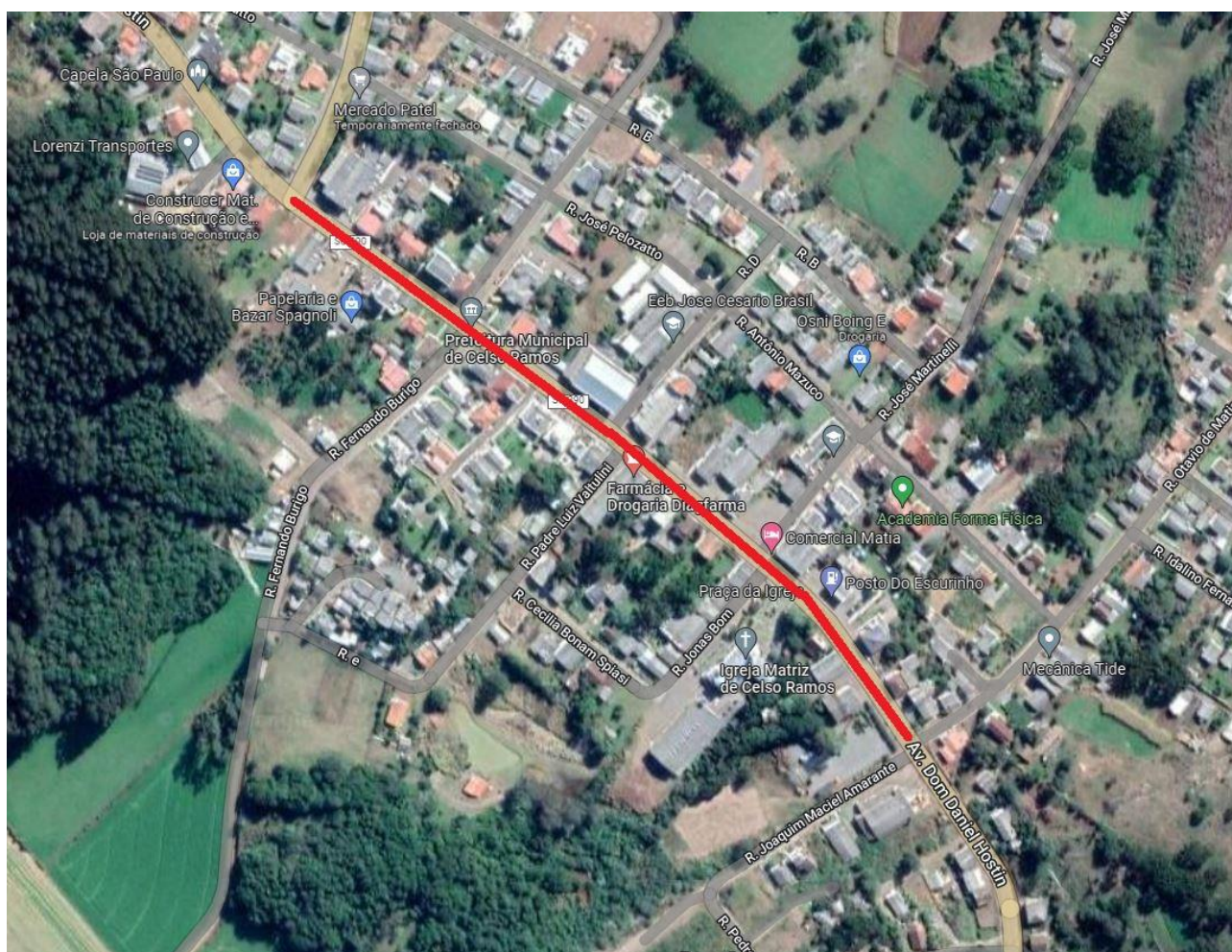
Trecho a ser revitalizado

A obra a ser revitalizada localiza-se na Avenida Dom Daniel Hostin, Centro, Celso Ramos - SC.